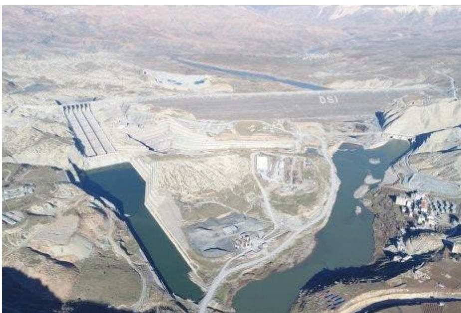
Ilustración 4: Sitio de la presa de Ilisu; fuente: Dogru Haber 6.3.2019,

El gobierno empleó a cientos de personas adicionales como "guardias municipales" y los armó para la "seguridad" de la obra de la represa de Ilisu, que se encuentra cerca de las zonas disputadas desde la década de 1980 por el ejército turco y la guerrilla del PKK. Miles de "agentes de seguridad" se involucraron en operaciones militares cerca de la obra de la represa; desde 2015 muchas áreas alrededor de Hasankeyf e Ilisu han sido declaradas como zonas militares de no acceso. La militarización ha alcanzado tal nivel que se ha convertido en imposible visitar el lugar como investigador independiente. El estado de emergencia declarado en julio de 2016 ha hecho casi