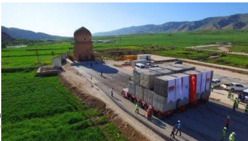
Ilustración 5: Mausoleo de Zeynel Bey durante la reubicación en mayo de 2017

Sin embargo, la situación explotó en 2018. A fines de 2017, los funcionarios del gobierno anunciaron que los dueños de las tiendas de Hasankeyf deberían mudarse a los nuevos edificios de tiendas construidos en Nuevo Hasankeyf en marzo de 2018, mientras los habitantes aún vivían en Hasankeyf. Debido a que las nuevas casas en Nuevo Hasankeyf estaban lejos de completarse, los dueños de las tiendas y los familiares organizaron la esperada protesta. Aunque portaban