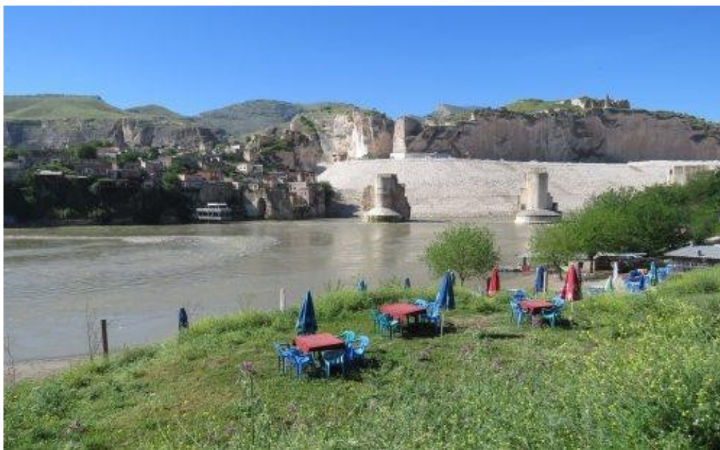
Ilustración 7: La nueva presa alrededor de la Roca del Castillo