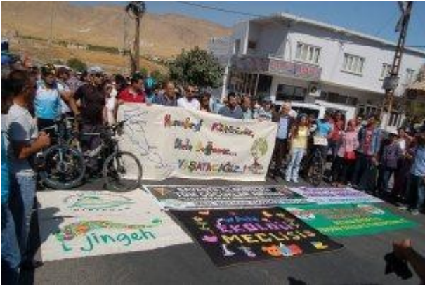
Ilustración 8: 1er Día de Acción Global de Hasankeyf, 20.09.2015, Hasankeyf