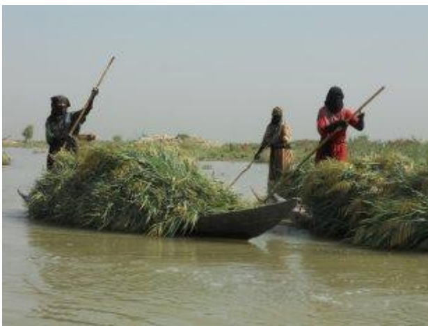
Ilustración 2: Arabes de los pantanos del sur de Iraq

El Proyecto Ilisu está situado en la Mesopotamia superior, la "cuna de la civilización", cuna de los primeros asentamientos humanos. El Proyecto Ilisu afectaría a más de 400 sitios arqueológicos - toda el área afectada aún no ha sido examinada completamente. Hasta la fecha solo se han realizado excavaciones en alrededor de 20 sitios. El pueblo de Hasankeyf que sería inundado por el embalse de Ilisu, de 12.000 años de antigüedad, combina de manera única un rico patrimonio cultural con un importante entorno biológicamente diverso. Esto es también debido a que ha sido habitada ininterrumpidamente. Por eso Hasankeyf se ha convertido en el símbolo de la lucha contra el Proyecto Ilisu. Hasankeyf se encuentra en la histórica Ruta de la Seda, y fue una de las ciudades regionales más grandes en la época medieval, e incluye trazas de 20 culturas distintas, orientales y occidentales, varios cientos de monumentos y hasta 5.500 cuevas excavadas. Es un área extensa y precisa una excavación meticulosa de decenas de años. Hasankeyf y la zona que adyacente al valle