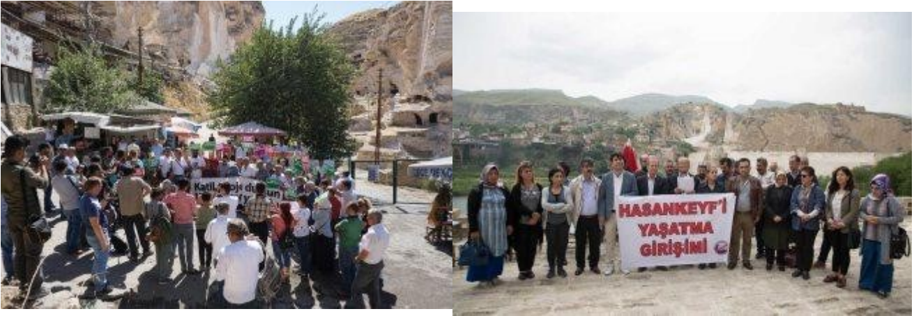
Ilustración 10: días de acción para Hasankeyf, 2017 y 2018, fuente: HYG

Desde 2012, Hasankeyf Matters ( www.hasankeyfmatters.com ), un grupo de voluntarios de Estambul y Batman, está involucrado en la campaña. Se centra en la conservación del patrimonio cultural de Hasankeyf. En 2015, el Movimiento Ecológico de Mesopotamia, un nuevo movimiento amplio de activistas y organizaciones con orientación ecológica en el Kurdistán bajo dominio turco, se unió a la campaña contra el Proyecto Ilisu. Solo en 2015, se organizaron más de cinco manifestaciones junto con HYG, dos de ellas en Dargecit, la ciudad contigua a la represa.