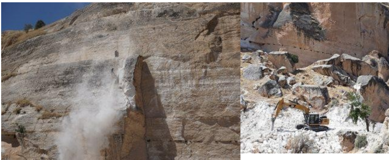
Ilustración 6: Destrucción de una pieza de roca a mediados de agosto de 2017; Equipo pesado trabajando con escombros

El reclamo oficial de rescatar a Hasankeyf consiste principalmente en la reubicación de siete