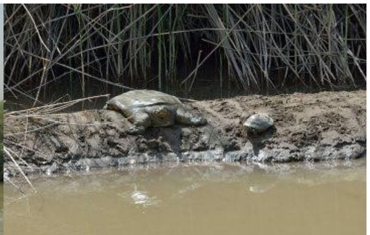
Ilustración 3: Tortuga de caparazón blando